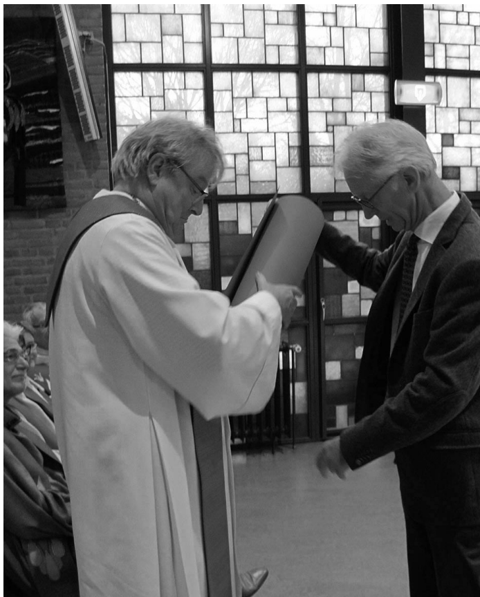
Johan overhandigt cadeau