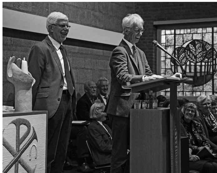
Act voor twee personen